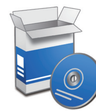
アイデュープリソフトウェア