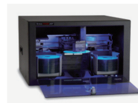
Bravo 4102XRP CD/DVD/Blu-Ray

搭載ドライブ: 1～2台 メディア装填数: 50～100枚 プリンタ: CMYKインクカートリッジ 据置モデル