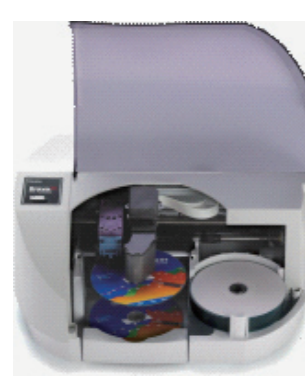
Bravo SE CD/DVD/Blu-Ray

搭載ドライブ: 1台 メディア装填数: 20枚 プリンタ: カラーインクカートリッジ 据置モデル