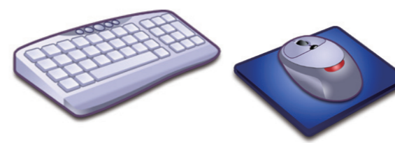
キーボード・マウス